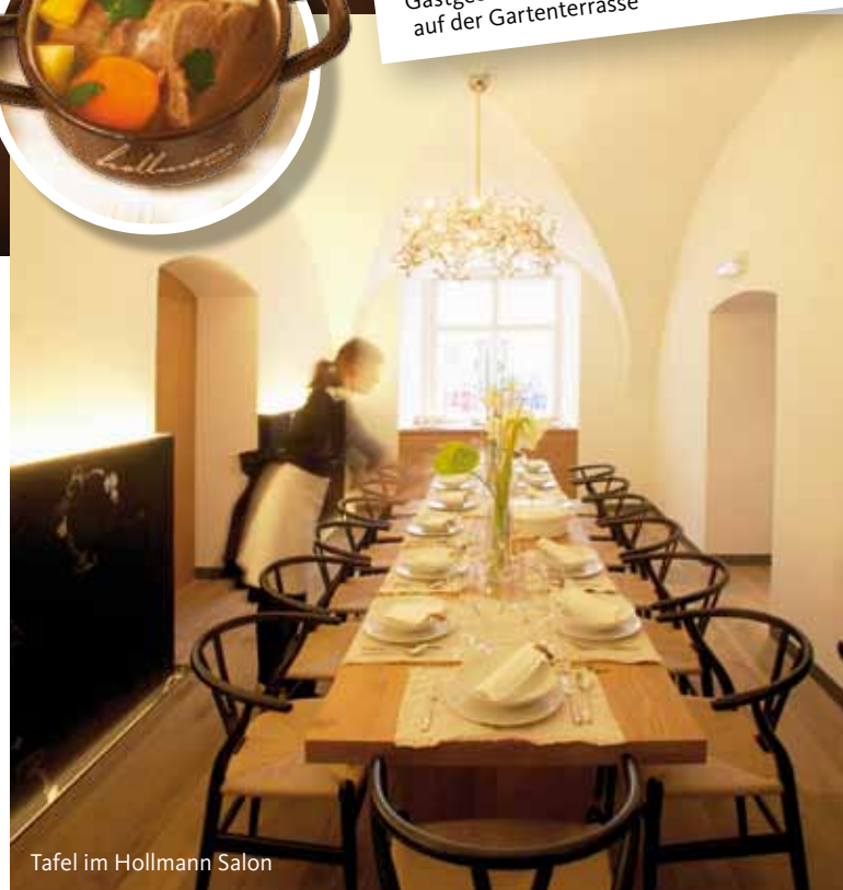
Tafel im Hollmann Salon

Als gelernter Koch und Konditor legt der Patron größten Wert auf gutes Essen. Das Frühstück in der Hollmann Beletage ist schon legendär, es gilt als das beste Wiens. Gleich um die Ecke liegt der Hollmann Salon, wo die Gäste mit regionaler Küche auf Haubenniveau verwöhnt werden. Für Feiern oder geschäftliche Anlässe steht ein Theater-Salon für bis zu 65 Gäste zur Verfügung.