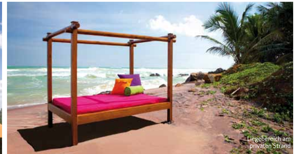
Liegebereich am privaten Strand