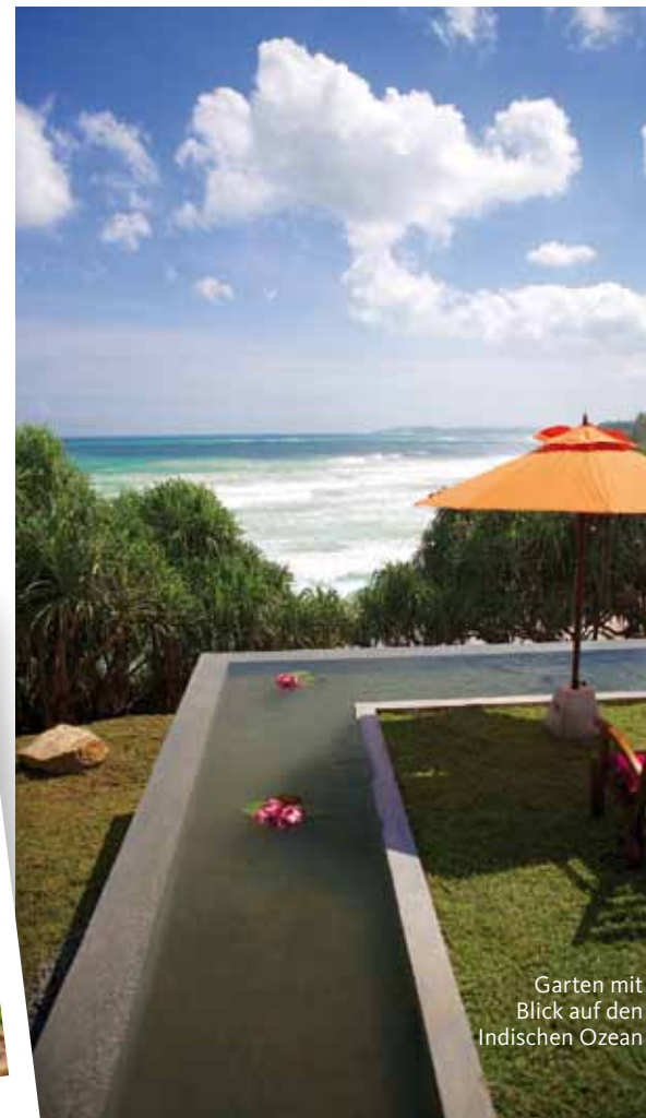
Garten mit Blick auf den Indischen Ozean